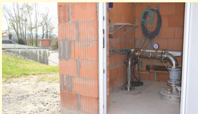
Die beiden Trinkwasserbrunnen auf dem Gelände des Belmer Wasserwerkes wurden in den vergangenen zwölf Monaten von Grund auf saniert. Insgesamt rund 224.000 Euro hat der Wasserverband Wittlage in die Wiederertüchtigung investiert.

Zwei Trinkwasserbrunnen am Belmer Wasserwerk konnten jetzt nach einer umfassenden Vollsaniierung wieder in Betrieb genommen werden. Zwei und vier Jahre waren die Brunnen vom Trinkwassernetz getrennt, die Baumaßnahmen zur so genannten Wiederertüchtigung haben rund ein Jahr gedauert. Der Austausch der Brunnenrohre, der gesamten Fördertechnik, sowie an jedem Brunnen der Bau einer neuen „Brunnenstube“ veranschlagt der Wasserverband Wittlage mit insgesamt rund 224.000 Euro.