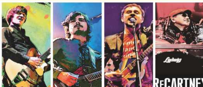
Beste musikalische Unterhaltung ist bei ReCartney garantiert.

In ihrer einzigartigen Show verneigen sich die vier professionellen Musiker vor dem musikalischen Schaffen der lebenden Legende Sir Paul McCartney.