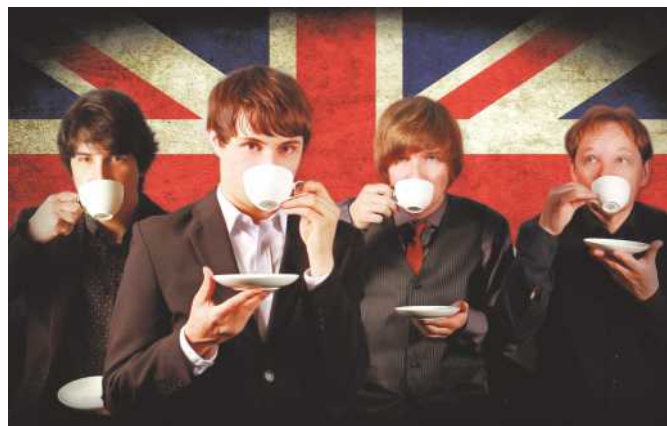
ReCartney steht am 21. Juni 2019 ab 18.30 Uhr auf der Bühne an der Belmer Mühle.

Der Verein Belmer Mühle präsentiert mit ReCartney hervorragende Beatles und Paul McCartney Musik.