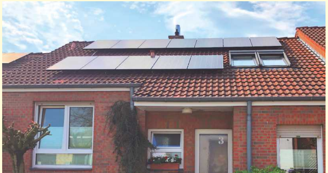
Lohnt sich die Solaranlage auf meinem Dach? Diese und weitere Fragen von Hauseigentümerinnen und -eigentümern beantworten Fachleute beim Solar-Check plus.

„Im Vergleich zum bisherigen Solar-Check wird den Energieberatern mehr Zeit für den Blick auf Details eingeräumt, und die Rat-suchenden erhalten im Nachgang einen schriftlichen Bericht zur Solareignung ihres Hauses,“ beschreibt Karin Merkel von der Ver-