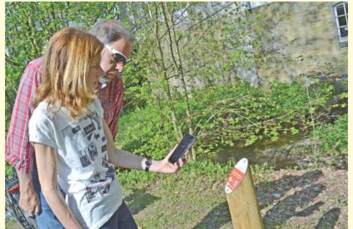
An jeder Sehenswürdigkeit auf der Hufeisen-Route können sich Radler mit dem Mobiltelefon spannende Geschichten erzählen lassen.

Spannende Sagen in abwechslungsreicher Landschaft gepaart mit Bewegung an der frischen Luft – all das bietet die neue Hufeisen-Route. Der 105 Kilometer lange Rundkurs führt durch die sechs Kommunen der ILE-Region „Hufeisen“: Belm, Bissendorf, Georgsmarienhütte, Hagen a.T.W., Hasbergen und Wallenhorst. Radler erwarten dort zahlreiche Sehenswürdigkeiten, von denen jede buchstäblich ihre eigene Geschichte zu erzählen hat. Offiziell eröffnet wird die Hufeisen-Route am 25. Mai am Alten Pfarrhaus in Hagen a.T.W. – natürlich im Sattel.