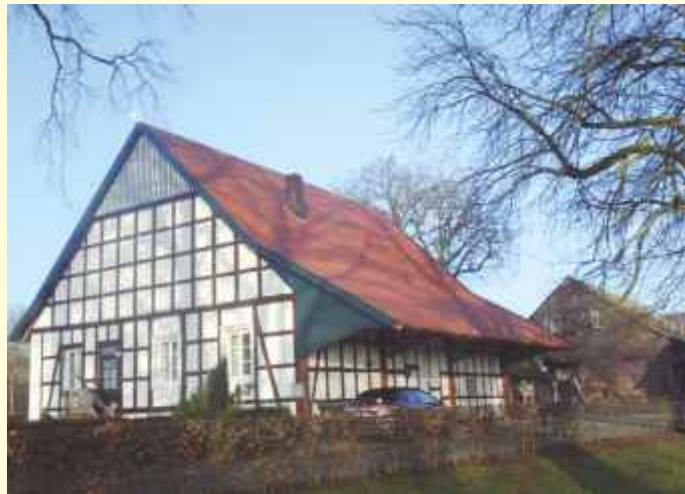
Ein erfolgreiches Beispiel: Die Sanierung der Fachwerkscheune auf dem Hof Grimm an der Dorfstraße wurde Ende 2014 mit Mitteln aus dem Dorferneuerungsprogramm gefördert. Die marode Dachkonstruktion wurde erneuert und ortsbildtypische Hohlziegel als Dachpfannen gewählt.

Seit 2009 nimmt der Belmer Ortsteil Vehrte am Dorferneuerungsprogramm des Landes Niedersachsen teil. Wesentlicher Bestandteil dieses Förderprogramms ist neben öffentlichen Maßnahmen wie der Gestaltung des Dorfplatzes am Wittekindsweg/Vehrter Kirchweg und der „Erlebnisroute Schwarzkreidegrube“ insbesondere auch die Förderung privater Sanierungsvorhaben an Wohnhäusern, Scheunen, Ställen und Gärten. Voraussetzung ist, dass die Gebäude oder Hof- und Gartenanlagen als ortstypisch eingestuft werden und die geplante Sanierung der Erhaltung des ortstypischen Charakters dient.