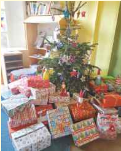
und verpackt haben jetzt die Kinder der Kindertagesstätte in Vehrte. Die Weihnachtspäckchen sind für eine soziale Einrichtung in Osnabrück bestimmt, die Kindern und Müttern in Not Unterkunft bietet.

In der Vorweihnachtszeit haben sich die Kinder in der Kindertagesstätte Vehrte mit dem Thema „Wie helfe ich anderen Menschen, denen es nicht so gut geht und die zeitweise kein Zuhause haben“ befasst. Dabei stellten sie sich auch die Frage, wie man Kindern in Not zu Weihnachten, dem Fest der Nächstenliebe, eine kleine Freude machen kann. Es entstand die Idee, gemeinsam Weihnachtspäckchen zu packen, um Geschenke weiterzugeben. Familien und Mitarbeiterinnen der Kindertagesstätte in Vehrte haben dazu einen großen Berg Geschenke gesammelt.