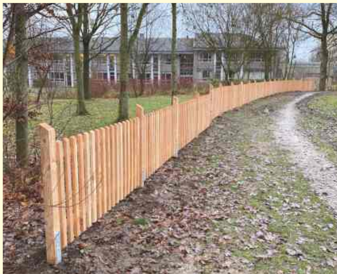
Ein neuer Holzzaun grenzt im Bürgerpark das Schulgelände vom öffentlichen Bürgerpark ab.

Mitte Dezember wurde ein schmucker Holzzaun aufgestellt, der den Bereich als abgesperrten Bereich und Schulhofgelände kennzeichnen und eingrenzen soll. Mit neuer Beleuchtung, die über Bewegungsmelder gesteuert wird, soll der gesamte Bereich sicherer gemacht und ungebetenen Besuchern keinen unbeaufsichtigten Aufenthalt ermöglichen. Der Rückschnitt der Weiden trägt ebenfalls dazu bei.