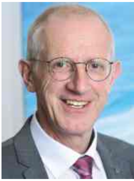
Viktor Hermeler -Bürgermeister-