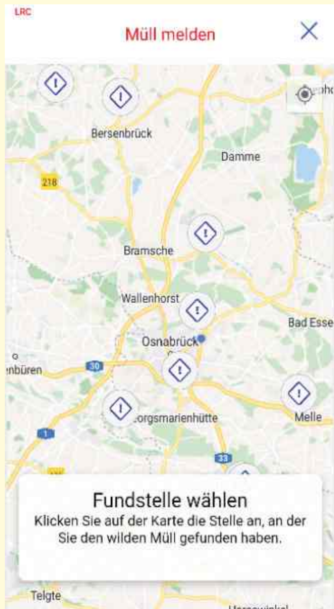
Illegale Müllablagerungen können mit der AWIGO-App gemeldet werden.

Bereits seit 2009 bietet die AWIGO Abfallwirtschaftsgesellschaft des Landkreises Osnabrück viele ihrer Dienstleistungen gebündelt in der unternehmenseigenen App für Endgeräte mit iOS- oder Android-Betriebssystemen an. Viele Bürgerinnen und Bürger greifen als AWIGO-Kunden bereits auf das Angebot zurück und lassen sich etwa per Smartphone an die regelmäßigen Abfuhrtermine erinnern.