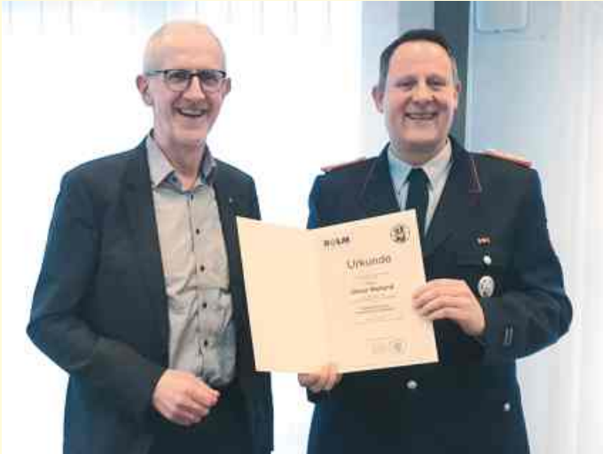
Bürgermeister Viktor Hermeler überreichte Hauptbrandmeister Oliver Weiland in einer Feierstunde im Rathaus die Ernennungsurkunde für eine weitere Amtszeit als Stellvertretender Gemeindebrandmeister.