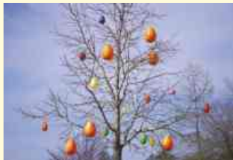
Geschmückter Osterbaum.

Nachdem das Wetter jetzt wieder schöner wird, laden die „Frühen Hilfen“ der Gemeinde Belm alle Eltern und deren Kinder zu einem etwas anderen Oster-Waldspaziergang ein. Entlang des ausgewiesenen Wanderweges „TERRA.track Richtstättenweg“ durch den Wald auf dem Schinkelberg ist in sichtbarer Entfernung und in geringer Entfernung vom Weg im Wald ein „Osternest“ versteckt, das es zu finden gilt. Ebenso kann ein mit Ostereiern geschmückter Baum aufgespürt werden.