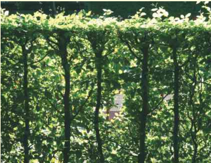
Die Hainbuchenhecke im heimischen Garten darf auch weiterhin mit der Heckenschere in Form gehalten werden. Nur „auf den Stock gesetzt werden“ darf sie laut Bundesnaturschutzgesetz in der Zeit von März bis September nicht.

„In der Zeit vom 1. März bis 30. September ist es verboten, Bäume außerhalb von Wald und Plantagen, Hecken, lebende Zäune, Gebüsche und sonstige Gehölze abzuschneiden und auf den Stock zu setzen.“ Den meisten Gartenbesitzern werden die Verbote § 39 des Bundesnaturschutzgesetzes nicht bekannt sein - obwohl auch Hobbygärtner von den Auflagen nicht ausgenommen sind.