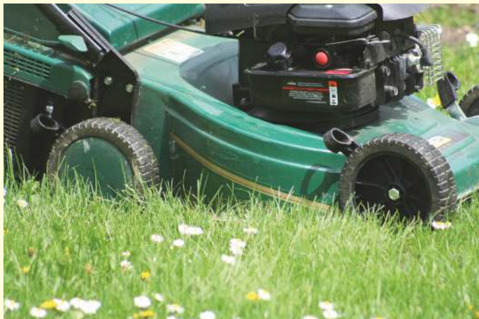
An Werktagen hat der Rasenmäher auch von 13 bis 15 Uhr Mittagspause.

Gerade im Frühjahr und Frühsommer stehen intensive Arbeiten im Garten an. Gelegentlich wird dabei im Übereifer die Mittagsruhe missachtet und es kann zu Streitigkeiten mit den Nachbarn kommen, wenn zur falschen Zeit der Rasenmäher läuft. Auch beim ersten gemütlichen Grillabend auf dem Balkon kann es schnell Ärger mit den Nachbarn geben, wenn der Rauch zum Störfaktor wird.