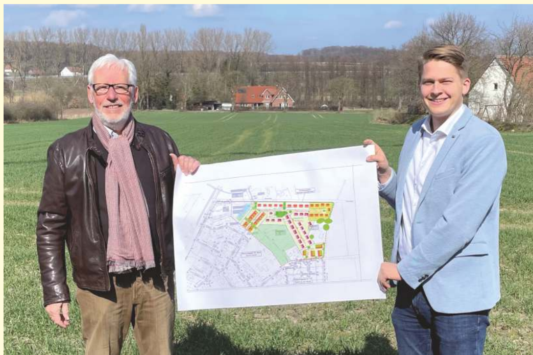
„Baugebiet Nördlich Schloßstraße“