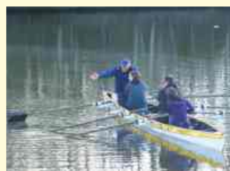
Die erste Ausfahrt im Ruderboot unter fachmännischer Anleitung.