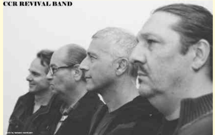
CCR REVIVAL BAND