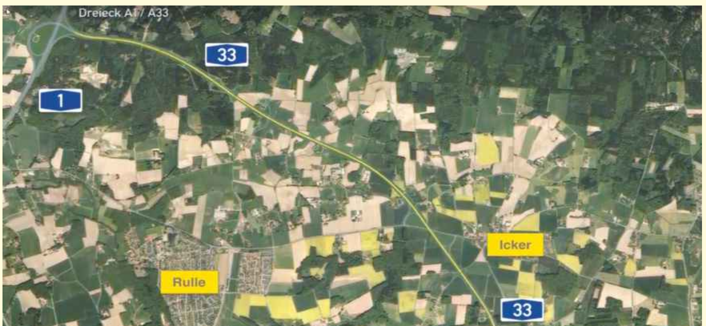
Trassenverlauf: Die geplante Trasse der A33-Nord.

Abzulehnen ist auch die Idee eines Verfügungsfonds, aus dem Umweltverbände bei einer Klage unterstützt werden. „Um das Kind beim Namen zu nennen: Sollte die Gemeinde hier an Umweltverbände spenden, wäre das eine rechtswidrige Umgehung der fehlenden Klagebefugnis“, führt Frank Ulrichs aus. „Wenn die Gemeinde kein Klagerecht hat bzw. nur eines, das auf tönernen Füßen steht, kann die Gemeinde das nicht dadurch hinbiegen, dass sie Geld der Steuerzahlerinnen und Steuerzahler einem klageberechtigten Verband überlässt, der in keiner Weise durch die gewählten Vertreterinnen und Vertreter der Gemeinde kontrolliert werden kann.“ Die FDP Belm wird nach einem Erfolg bei der Kommunalwahl 2021 hier genau hinschauen und unsinnige oder gar rechtswidrige Ausgaben nicht unwiderrprochen hinnehmen.