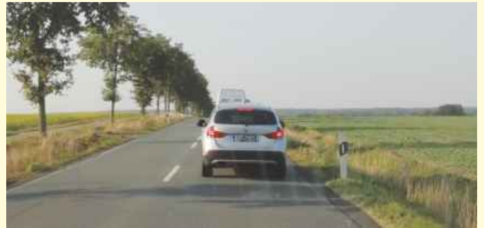
Stau: Der tägliche Stau-Ausblick vieler Pendlerinnen und Pendler.

Aber auch inhaltlich können die Stellungnahme und die Position der Gemeinde nicht überzeugen. Zum Ausbau der A 33 gibt es keine Alternative. Die sicherlich bestehende Auswirkung auf die Umwelt, werden durch den Nutzen für die Allgemeinheit aufgewogen. Das zusätzliche Verkehrsaufkommen durch die A33 wird als ausschließlich schädlich betrachtet, dabei stiftet auch dieser Nutzen. Bürgerinnen und Bürger, die Einkaufsmöglichkeiten, Beschäftigungsorte oder touristische Ziele besser erreichen, haben Vorteile. Und durch den Weiterbau der A33 werden Kreisstraßen, die durch Vehrte oder Icker verlaufen, entlastet.