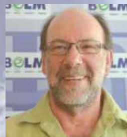
Eberhard Eckert - Foto Privat

Woran denken Sie zuerst, wenn Sie Ihre Lebenssituation betrachten? ... an Sicherung des persönlichen Wohlstands? ... welche Lebensmöglichkeiten uns die Zukunft bringen wird?