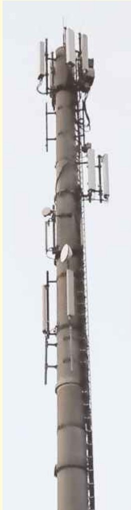
Einen Mobilfunkmast wie hier in Rulle benötigt auch Icker.

Es ist bitter, wenn statt Fakten Aberglaube regiert. Wesseln ergänzt: "Leider erleben wir bei den politischen Mitbewerbern häufig, dass Wissenschaft nur dann berücksichtigt wird, wenn es zur eigenen Agenda passt. Bei der Pandemiebekämpfung und beim Klimawandel wird zurecht die Wissenschaft hochgehalten. Wirtschaftswissenschaften und medizinische Evidenz werden aber ganz schnell zurückgestellt, wenn sie dem eigenen Gefühl zuwider laufen." Zumindest ist es laut Wesseln konsequent, dass Icker neben einer zukunftsgerichteten Verkehrsanbindung durch den Lückenschluss der A33-Nord auch der Zugang zum mobilen Datenverkehr vorenthalten werden soll. Die Freien Demokraten wollen weiter dafür kämpfen, dass Icker den Anschluss nicht verpasst – in mehrfacher Hinsicht! Es muss nun sehr schnell ein alternativer Standort für den Mast gefunden werden. Bietet sich ein solcher nicht an, muss der jüngste Beschluss des Verwaltungsausschusses rückgängig gemacht werden.