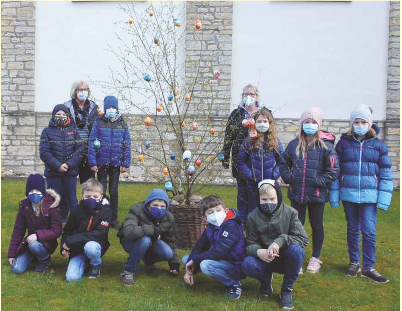
Die Schülerinnen und Schüler der Klasse 3/4 der Grundschule Icker verzierten in diesem Jahr die Ostereier für den „Eierbaum“ an der Kirche in Icker.