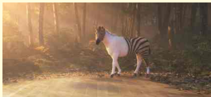
B2B_Keyvisual.jpg Hybridboden Hywood

In einer Studie des Herstellers konnten zwei Gründe herausgefiltert werden: der hohe Preis und die Vermutung, dass Holz den täglichen Anforderungen nicht gewachsen ist. Um auf die Wünsche der Konsumenten zu reagieren hat das Unternehmen ter Hürne einen hybriden Boden geschaffen, der die vom Verbrau-