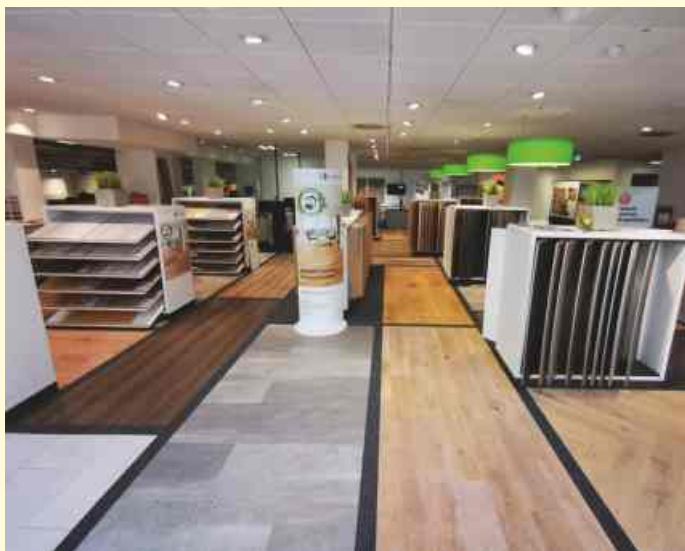
Bodenbelagsausstellung_3.jpg Ausstellungsfäche Baufachzentrum Nilsson in OS-Lüstringen

Hier können sich Interessierte Wand- und Bodenbeläge in unterschiedlichsten Licht-Situationen anschauen. Auch die Musterbauten bestehend aus über 90 unterschiedlichen Bauelementen zeigen interessante Kombinationsmöglichkeiten im Bereich der Fenster, Türen und Tore-Abteilung und Fassadensysteme in zeitlos schöner Optik. Weitere Informationen zum Sortiment und zur Ausstellung finden Sie unter www.nilsson.de .