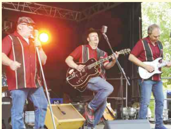
Zünftiger Rock’nRoll vom Allerfeinsten gibt es von der Band „Buddy & The Hotdogs“.