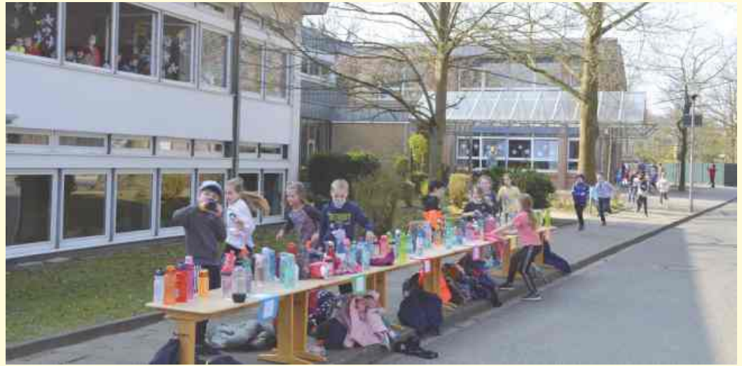
Jede Runde um die Schule bringt Geld für UNICEF: Angefeuert von den Mitschülerinnen und Mitschülern absolvierten Schülerinnen und Schüler aller Klassen der Grundschule Belm einen Spendenlauf zugunsten des Internationalen Kinderhilfswerks. Mehr als 7000 Euro sind dabei zusammen gekommen.