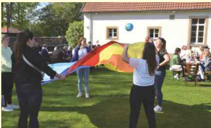
Gemeinsame Spiele fördern Zusammenhalt und Verständnis füreinander.