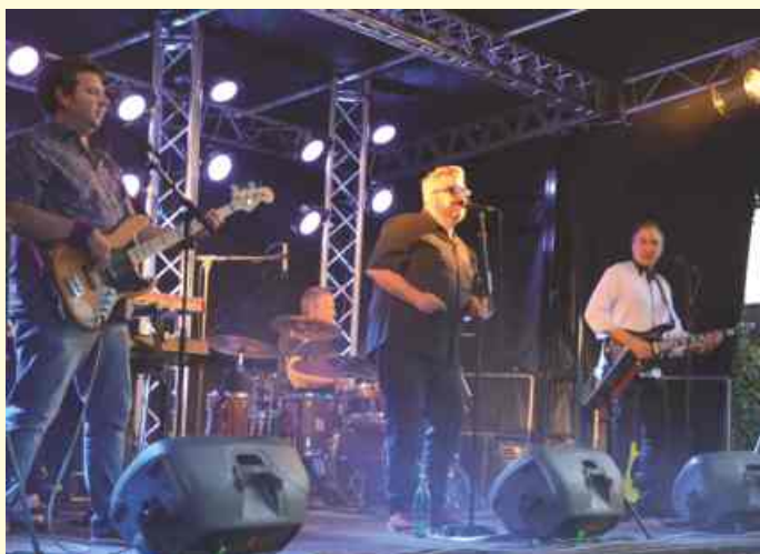
Begeisterte im vergangenen Jahr beim Finale vom „Kultursommer in den Biergärten“ in Vehrte, macht in diesem Jahr den Auftakt am 01.07. auf dem Marktplatz: Der Osnabrücker Kult-Rocker „Doc Moralez“

Den musikalischen Auftakt macht am 01.07. ab 18 Uhr der Osnabrücker Kult-Rocker „Doc Moralez“ mit seiner Band auf dem Marktplatz.