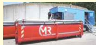
Der entwässerte Klärschlamm wird direkt in den Transportbehälter für den Abtransport befördert.

Nach der Entwässerung wird der Schlamm von einer Fremdfirma direkt zu einem Kraftwerk transportiert und dort verbrannt. Zukünftig wird der Wasserverband Wittlage die entwässerten Klärschlämme aus seinen Anlagen in einer Kooperation mit Entsorgern aus Niedersachsen und Nordrhein-Westfalen in einer zentralen Anlage in Ostwestfalen-Lippe thermisch verwerten, womit mittelfristig die Rückgewinnung von wertvollem Phosphor einhergeht.