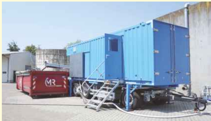
Nahezu die gesamte Anlage befindet sich in einem Container, der an den Kläranlagen des Wasserverbandes Wittlage zum Einsatz kommt.