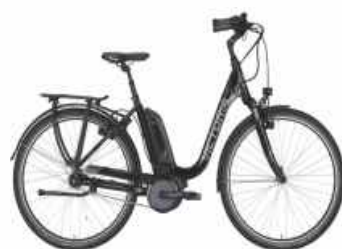
Victoria e. Trekking 7.5 C

Motor: Bosch Mittelmotor 400 Watt hydraulik Bremsen, Rücktritt SHIMANO "Nexus", 7-Gg.