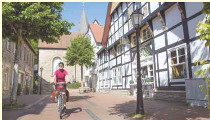
Ortskern von Hagen (c) Tourismusgesellschaft Osnabrücker Land mbH / Klaus Herzmann.

Am besten erfahren lässt sich die Route auf der „Hufeisen-Entdecker-Tour“ am 2. und 3. Oktober. Auf der vom Hufeisen-Regionalmanagement organisierten Reise radeln die Ausflügler auf der kompletten Route einmal rund um Osnabrück. Von Georgsmarienhütte aus geht es mit Unterstützung des Radreispezialisten Mevelo über Hagen a.T.W. und Hasbergen nach Wallenhorst, wo die Teilnehmer im Hotel Lingemann übernachten.