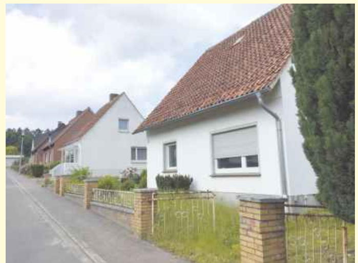
Erbaut in den 50er Jahren. Heute Leerstand. Sanierung? Zukunft!