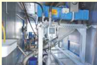
Moderne Technik im Inneren der Anlage.

Die Mobile Schlammmentwässerung ist in einem schallisolierten Container von ca. acht Metern Länge untergebracht. Das Herzstück der Anlage ist die Zentrifuge, welche mit hoher Drehzahl und Gegendruck den Klärschlamm weiter entwässert. Zudem ist im Container