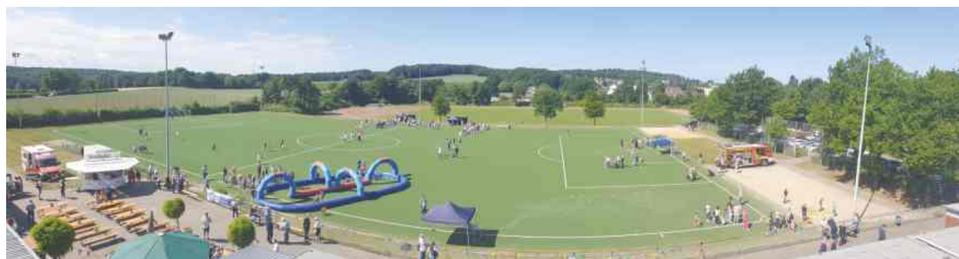
Der Sportplatz am Heideweg bot für das Sportfest der Kita Astrup viel Platz mit tollen Aktionen für Jung und Alt.