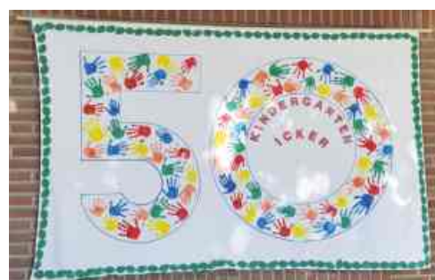
Der Kindergarten in Icker feiert in diesem Jahr sein 50-jähriges Bestehen.

Musikalisch und schauspielerisch startete das Kindergartenfest in Icker mit dem Lied der „Bremer Stadtmusikanten“, das von den Kindern verkleidet und mit Instrumenten begleitet wurde, und auch sonst standen Märchen im Mittelpunkt des Festes anlässlich des 50. Kita-Geburtstages.