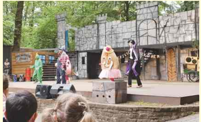
Auf der Freilichtbühne Reckenfeld erfreuten sich die Kinder über das Musical „Ritter Rost und die neue Burg“.

Wir haben uns das Stück „Ritter Rost und die neue Burg“ angeschaut und hatten die besten Plätze ganz vorne. Dabei durften wir ganz viele Lieder mitsingen, weil es ein Musical war. Es war sehr lustig und zum Schluss wurde viel geklatscht. Es war ein ganz schöner Vormittag.