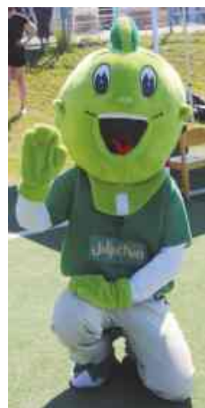
Maskottchen „Jolinchen“ begleitete das Sportfest.

Am Samstag, 11. Juni, war es endlich soweit: Die Kita Astrup startete bei Sonnenschein und sommerlichen Temperaturen zu einem einmaligen Sportfest unter dem Motto „Kita meets SVC“ auf dem Gelände des Sportzentrums am Heideweg. Hier konnten die 130 Kinder gemeinsam mit ihren Geschwistern, Eltern, Verwandte und Freunden einen bunten Tag erleben. In den vergangenen Wochen hatten wir uns intensiv mit dem Thema Bewegung, Ernährung und Entspannung beschäftigt. Begleitet wurde