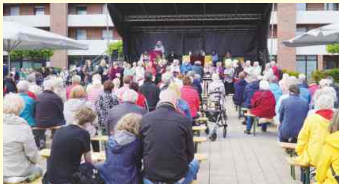
Gut besuchter Pfingstmontags Gottesdienst auf dem Marktring in Belm.

Pfingstmontag-Gottesdienst auf dem Marktplatz