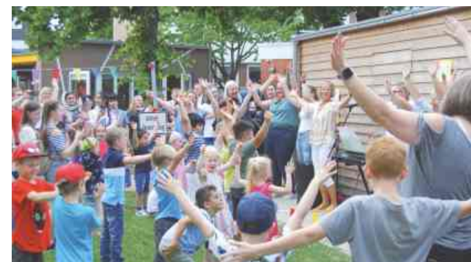
Mit viel Spaß, Musik und Gesang wurde das Einweihungs-Sommerfest in Vehrte eröffnet.

Erst Sommerfest von Krippe und Kita, dann Einweihung der neuen Räume