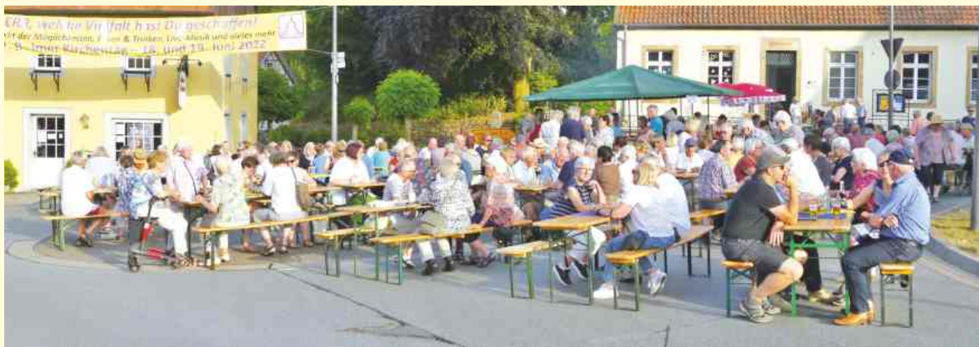
Der 2. Belmer Kirchentag fand mitten auf dem abgesperrten Kreisverkehr am Belmer Tie statt.

Gemeinden organisieren Kirchentag / Rund 20 Gruppen und Vereine beteiligt