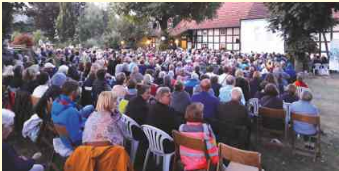
Open Air-Kino im Süden des Osnabrücker Landes: Das Sommerflimmern – Kino auf dem Lande war 2019 zu Gast auf dem Hof Seidel-Lott in Melle-Suttorf.

Vom Museum zum Erhalt historischer Landtechnik in Glandorf über den Kirchplatz in Ostercappeln bis zum Biolandhof Brummer-Bange in Ankum erkundet das Open Air-Kino vom 22. Juli bis zum 13. August, was „Freiheit“ im weitesten Sinn bedeuten kann.