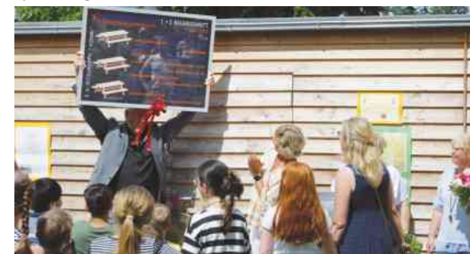
Symbolische Geschenkübergabe der Architekten und Handwerker zur Einweihung - die drei Massivholz-Sitzgruppen werden noch einen Platz im Außengelände der Kita finden.

Damit nicht genug. Im ersten Geschoss ist nach Umbau eine 4. Kindergartengruppe als Integrativgruppe mit 17 Kindern, davon 4 Plätze für Kinder mit besonderem Förderbedarf, entstanden. Dazu gibt es einen großen Mitarbeiterraum, ein Atelier, ein Snoezelraum und zwei Personal- WC's. Und im neuen Anbau gibt es nun eine Cafeteria und eine neue Küche. Im letzten Bauabschnitt schließlich wurden verschiedene Umbauten im Bestand gemacht, wie Abstellraum, Turnraum, Personalgarderobe, zwei Besprechungs- und Abstellräume und ein Elterncafé.