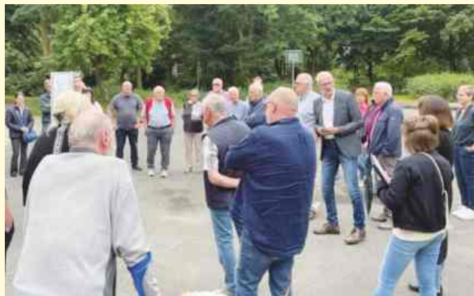
Beim Bürgerforum in Belm am „Ententeich“ wurden die Pläne für die Umgestaltung der Grünanlage vorgestellt und von den zahlreich anwesenden Bürgerinnen und Bürgern kritisch betrachtet und kommentiert.

Unter anderem ging es um die mangelhafte Breitbandanbindung von Vehrte, um von Hecken zugewachsene Bürgersteige, Chancen der Verlängerung des Radschnellweges und Kritik an der neuen Taktung des Busverkehrs.