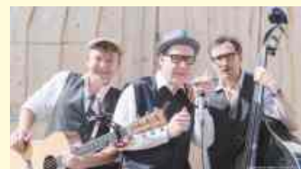
Charmantes Entertainment: Die Musiker von „Music to go“ Rock'n'Roll, Oldies-Goldies und so manches aus der Schlagerkiste. Ihr Auftritt auf dem Belmer Kultursommer ist am Freitag, 05. August.

Online gibt es den Flyer unter www.belm.de/kultursommer zum Herunterladen.