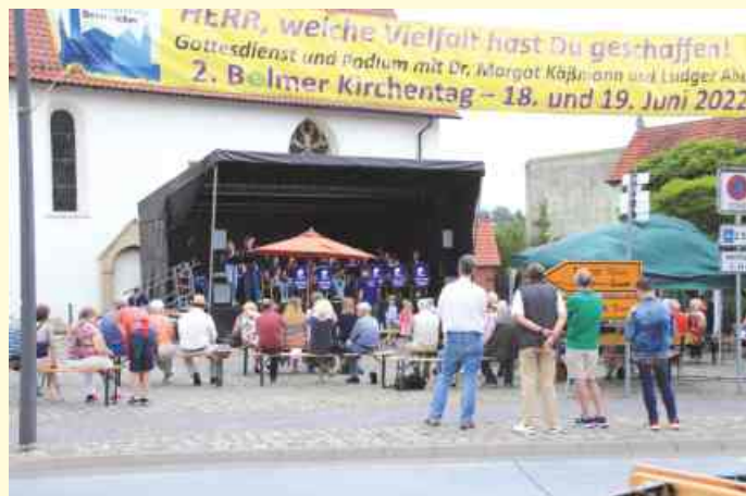
Frühschoppen mit der Bigband der Angelaschule Osnabrück

Der Pflichtdienst für junge Menschen, Kinderarmut und die Situation von Familien, die Corona-Pandemie, der Ukrainekrieg, die Behandlung von Geflüchteten und die Reform der Kirche –