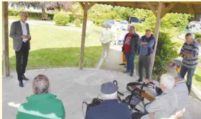
Bürgerforum mit dem Bürgermeister auf dem Dorfplatz in Vehrte.

Am 13. Juni fand das Bürgerforum in Vehrte auf dem Dorfplatz vor dem Jugendtreff statt. Nach dem Verwaltungsbericht des Bürgermeisters über allgemeine Themen aus der Verwaltung, etwa der geplanten Schulhofumgestaltung in Vehrte, einem Sachstandsbericht zum Bahnhof und Infos zu neuen Verkehrsdisplays, hatten die Bürgerinnen und Bürger Gelegenheit, Fragen zu stellen.