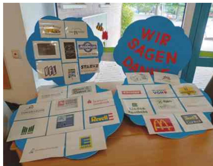
Das Kita-Fest wurde von vielen Sponsoren und Förderern unterstützt.

Als Höhepunkt wurden dann die vielen gespendeten Tombola Preise ausgegeben. Wir möchten uns auf diesem Wege nochmal bei allen Sponsoren und Helfern bedanken.