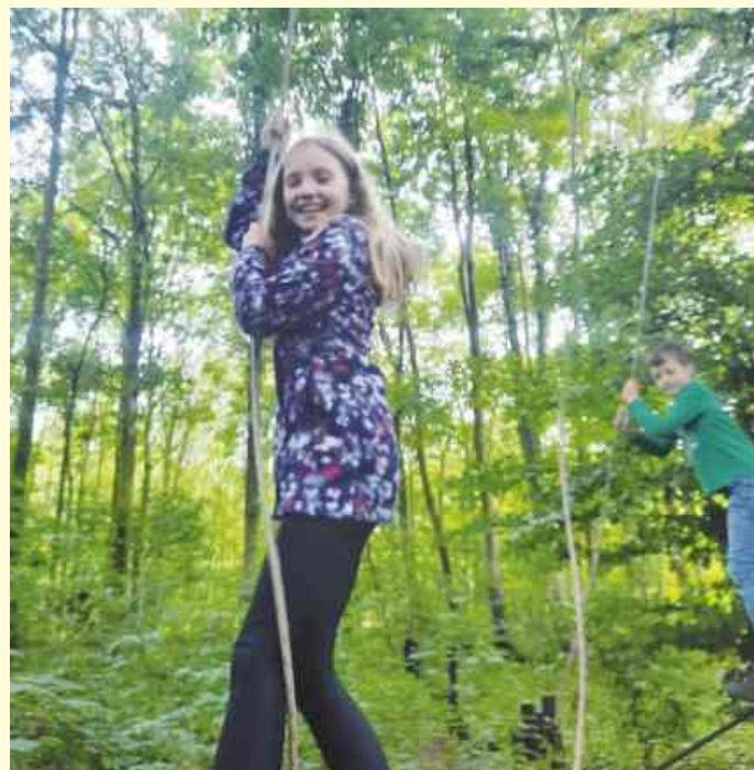
Im Niedrigseilgarten brauchten die Kinder beim Balancieren viel Geschick.

Danach wurden Holzstämmе geholt und eine Brücke gebaut. Alle Kinder mussten ein Holzende anfassen, und nacheinander durften dann alle über die Brücke laufen. Das war ganz schön wackelig.