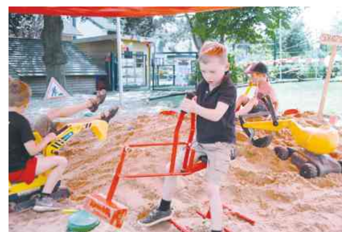
Auf der kleinen „Kita-Baustelle“ war viel Betrieb und mit den Baggern konnte im Sand nach Schätzen gesucht werden.

Beim Sommerfest haben wir unsere neu entstandenen Lernwerkstätten Forscherecke, Schreib- und Lesewerkstatt, Montessoriwerkstatt, Mathe- und Konstruktionswerkstatt geöffnet, vorgestellt und zum Ausprobieren eingeladen.