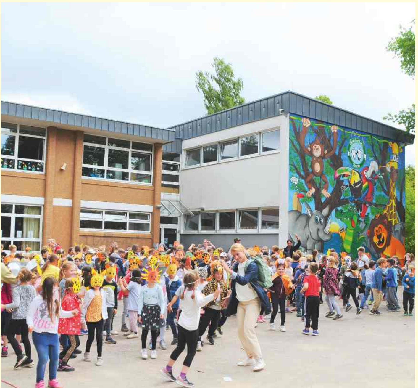
Mit lustigen Tiermasken, Musik und Tanz feierten alle Belmer Grundschulkinder die Einweihung des neuen Dschungel-Bildes an der Giebelwand ihres Schulgebäudes.