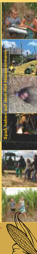
Spaß haben auf dem Hof Hauswörmann