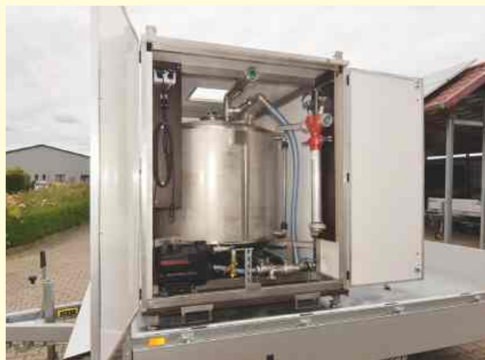
Hinter dem schlichten Gehäuse verbergen sich die Edelstahltanks

Per Anhänger können die Behälter einfach an Ort und Stelle gebracht werden.