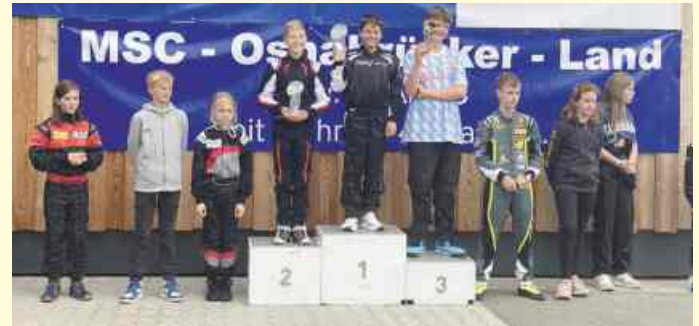
Siegerehrung K3 des MSC Osnabrücker Land e.V.