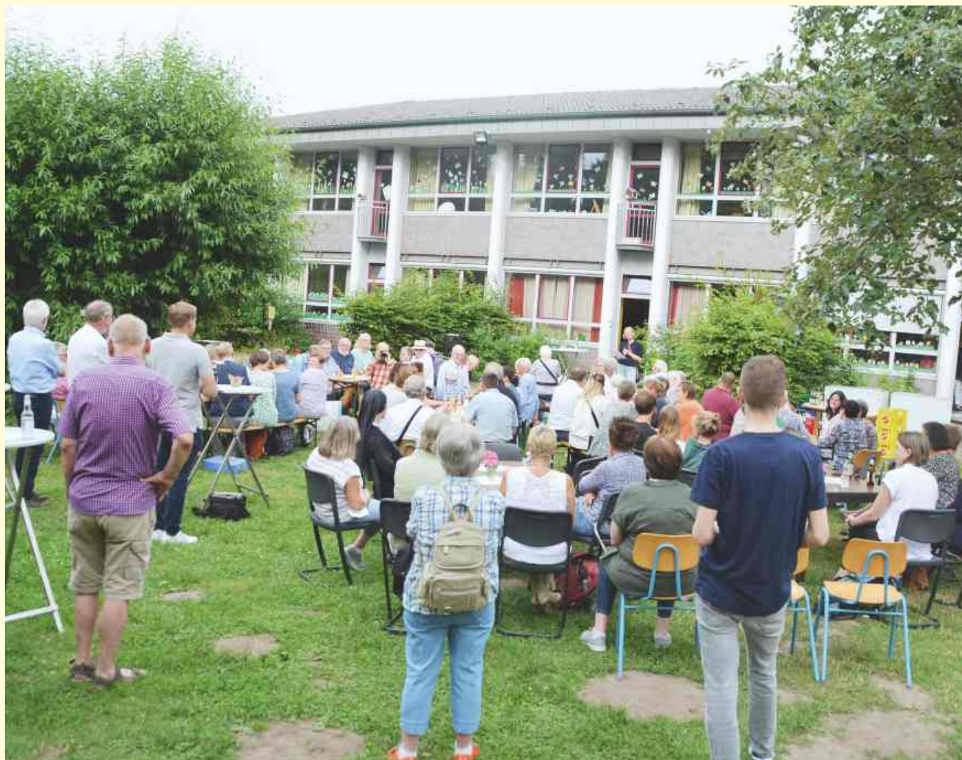
Mit vielen Gästen feierte der Offene Kindertreff an der Ringstraße jetzt seinen 25-jährigen Geburtstag. Bereits im Juni wurden mit den Kindern im Rahmen eines großen Kinderfestes das Jubiläum gefeiert.