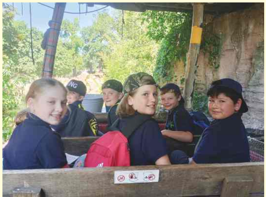
Bei der Bootsfahrt durch die Afrikalandschaft hatten die Kids der Grundschule Icker im Erlebnis Zoo Hannover viel Spaß.