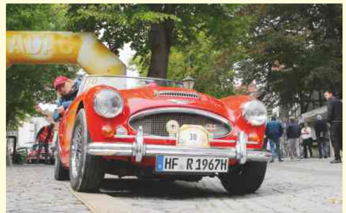
Bei der Sonderprüfung nach der Mittagspause auf dem Kirchplatz in Bad Essen können die Zuschauerinnen und Zuschauer der Oldtimer-Rallye „Wiehengebirge“ des MS Vehrte tolle historische Autos und Motorräder hautnah und in Aktion sehen.