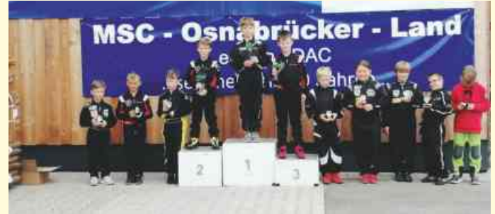
Siegerehrung K1 des MSC Osnabrücker Land e.V.

Homepage: http://www.msc-osnabruecker-land.de