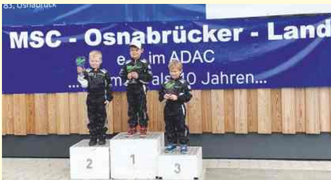
Siegerehrung K0 des MSC Osnabrücker Land e.V.