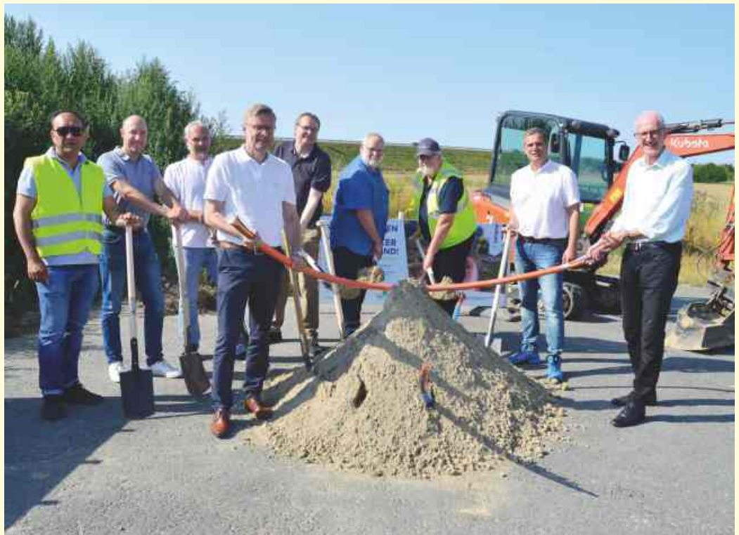
In Belm erfolgte jetzt der erste Spatenstich für den Breitbandausbau durch die Landkreis-Tochtergesellschaft TELKOS GmbH.