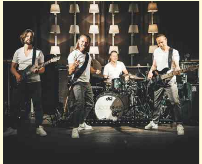
Die „Goodbeats“ aus Paderborn gehören aktuell zu den Top-Acts und bestreiten am Freitag, 26.08., ab 18 Uhr das Kultursommer-Finale auf dem Dorfplatz in Vehrte.