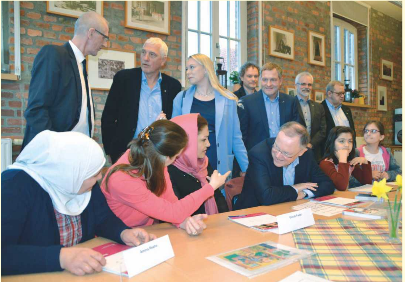
Ministerpräsident Stephan Weil (Mitte sitzend) im angeregten Austausch mit den Teilnehmerinnen des Deutschkurses.

In den Gesprächen wurde deutlich wie mit Engagement und Ideenreichtum, aber auch mit Basisarbeit und pädagogischer Ansprache den überwiegend jungen Leuten eine optimale individu-