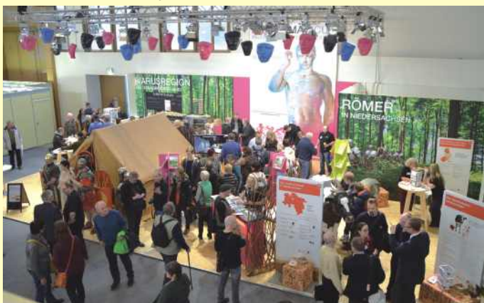
Gut besucht: Die „Römer in Niedersachsen“ am Messestand der VarusRegion auf der Internationalen Grünen Woche erfreuten sich regelmäßig einem sehr gutem Besucherinteresse.

Zehn Tage lang war die VarusRegion im Osnabrücker Land auf der weltgrößten Agrarmesse, der Internationalen Grünen Woche (IGW) in Berlin, vertreten. Neben den klassischen Landwirtschaftsthemen sind bei der Ausstellung auf dem Charlottenburger Messegelände immer auch die touristischen Angebote aus allen Ländern der Welt, den deutschen Bundesländern und Regionen ein großes Thema. Nach einem Messeauftritt vor sechs Jahren zum Großereignis „2000 Jahre Varusschlacht“ war die Region jetzt erneut Repräsentant auf dem Stand des Niedersächsischen Landwirtschaftsministeriums. Zentrale Figur war dabei der römische Legionär und Feldherr Germanicus, dem Museum und Park Kalkriese in diesem Jahr die Sonderausstellung "Ich Germanicus! Feldherr, Priester, Superstar" widmet.