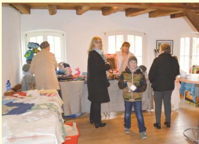
In der Belmer Mühle gab es Angebote für Groß und Klein.