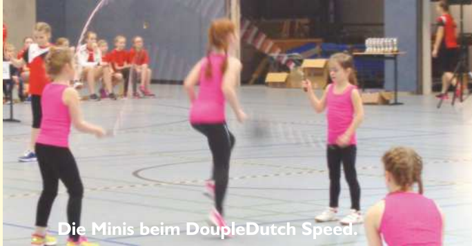
Die Minis beim DoubleDutch Speed.

Am 7.2.2016 fanden in Leer die Team-Landesmeisterschaften vom Niedersächsischen Turnverband statt. Der Belmer SVC startete mit 4 Mannschaften. Erfolgreich waren 2 Mannschaften, die jeweils den 2 Platz erzielten.