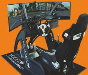
Unser neues Konzept ist Euer Vorteil!