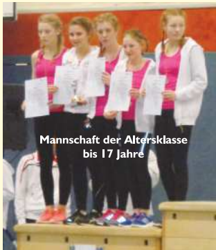
Mannschaft der Altersklasse bis 17 Jahre