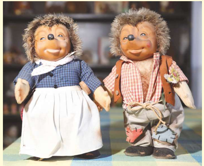
Stachelige Stars: Auch Mecki und Micki aus dem Igelmuseum in Bohmte sind beim Internationalen Museumstag am 22. Mai mit von der Partie.

ßerdem gibt es ganztägige Führungen. Das Igelmuseum hat an diesem Tag von 10 bis 17 Uhr geöffnet, der Eintritt ist frei.