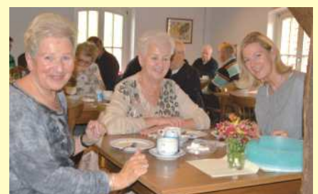
Im Veranstaltungsraum der Belmer Mühle findet sich immer ein Plätzchen für eine Pause und gute Gespräche.

Viele Belmer haben den Mittagsspaziergang für einen Besuch genutzt. Für alle Gäste hatten Mitglieder des Vereins wieder eine Cafeteria eingerichtet, die vor oder nach einem Bummel durch die Mühle zu Kaffee und Kuchen einlud.